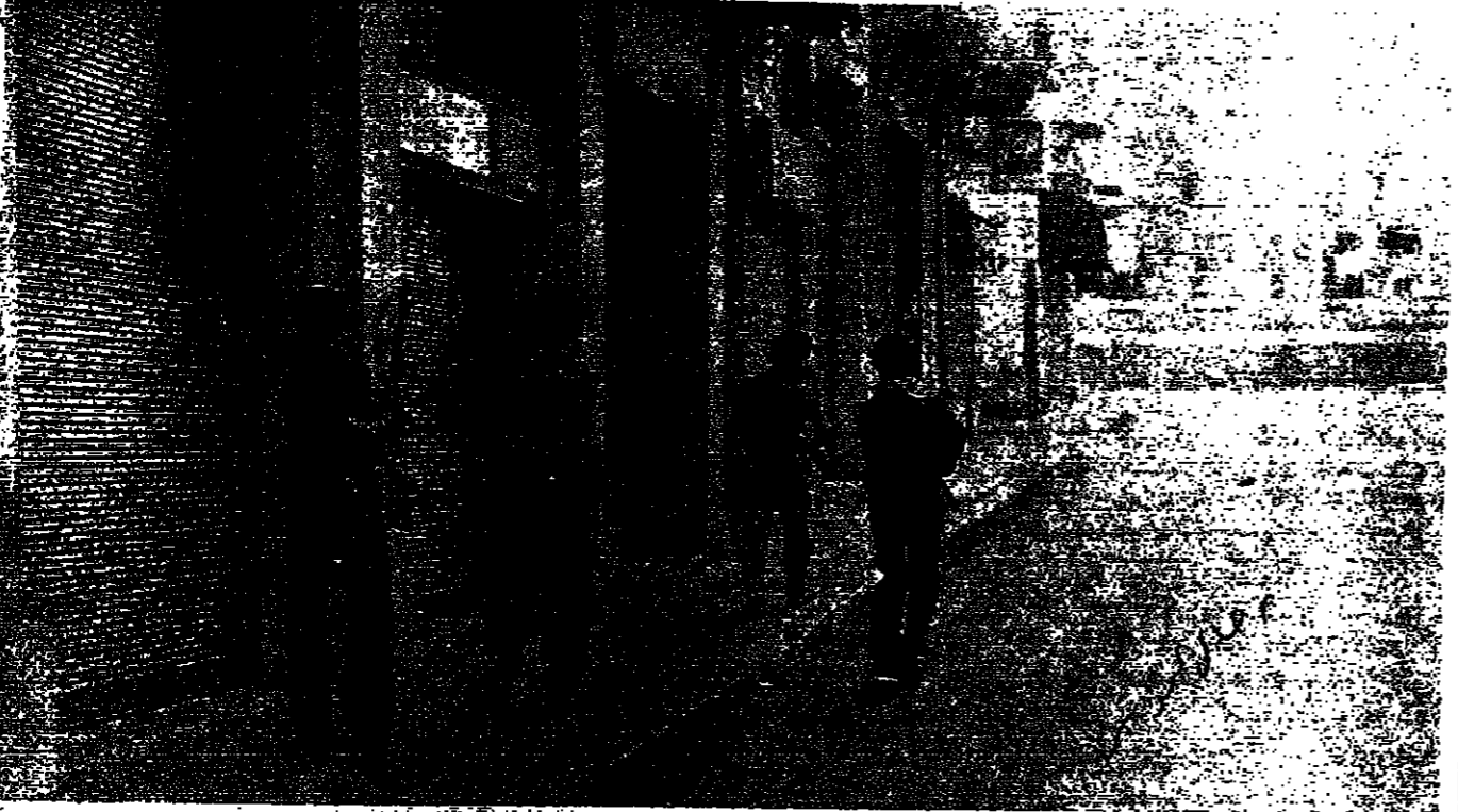
مسلحون غشي احد شوارع العاصمة امس